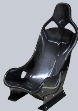
Rennfahrersitz im Prepregwerkzeug gefertigt

Die Firma ebalta ist seit über 40 Jahren Hersteller von Polyurethan- und Epoxidharzen für den Formen- und Werkzeugbau, den Gießereimodellbau und den Designmodellbau.